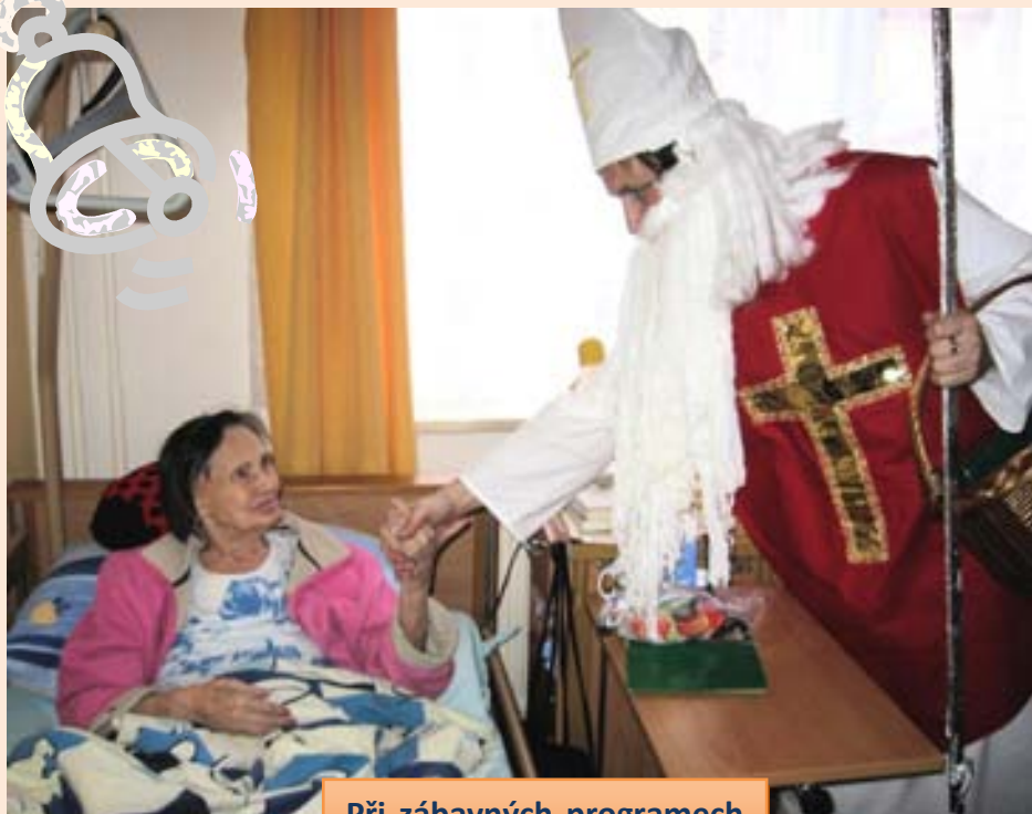
Při zábavných programech v našem domově často účinkují jeho zaměstnanci