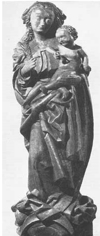
Foto: Vlevo rok 1941, vpravo 1975 „... lipové dřevo, výška 157,5 cm, vzadu vydlabáno. Poškozeny a odlomeny prsty na ruku Panny Marie, v dolní části ořezán obličej měsíce. Poškozená část podstavce doplněna tmelem. Povrch plastiky silně narušen červotočem; nepatrné zbytky polychromie /barevná výzdoba plastik/...“

Katalog Galerie výtvarného umění v Chebu „Chebská gotická plastika“ (1975)