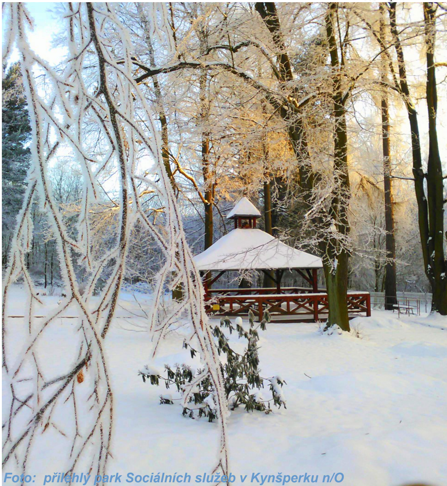
Foto: přilehlý park Sociálních služeb v Kynšperku n/O

Sociální služby, příspěvková organizace poskytují své služby za finanční podpory Karlovarského kraje.