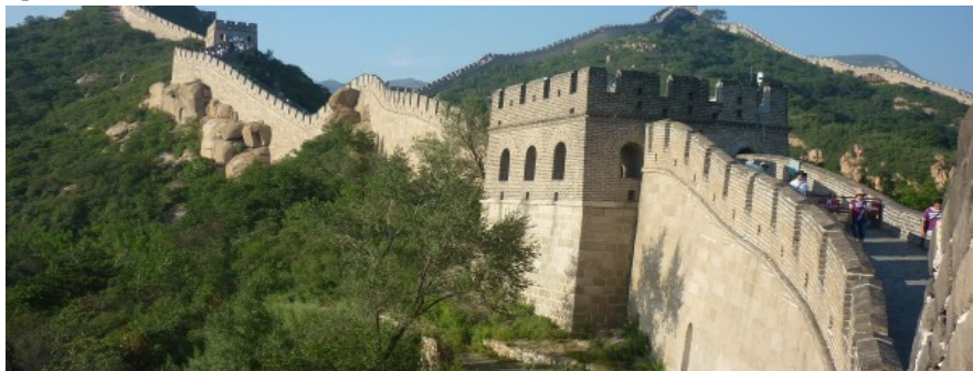
Foto: Čínská zeď měřící 8851 km.