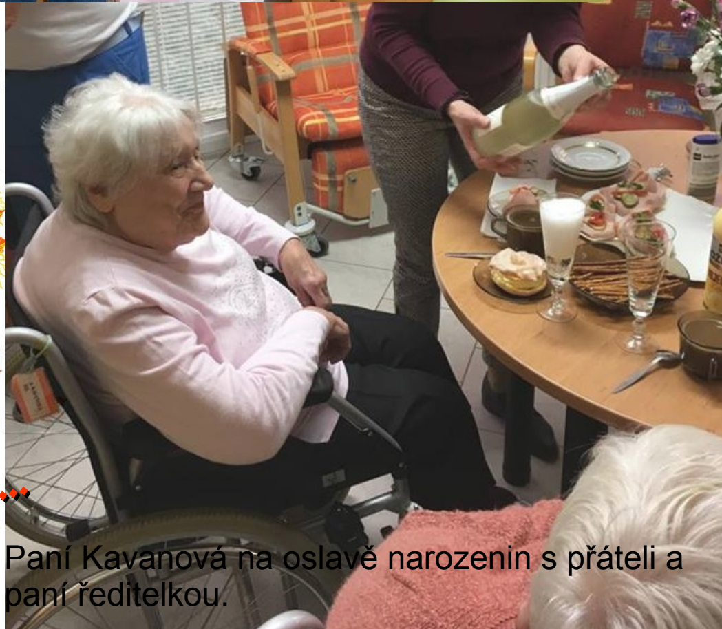
Paní Kavanová na oslavě narozenin s přáteli a paní ředitelkou.