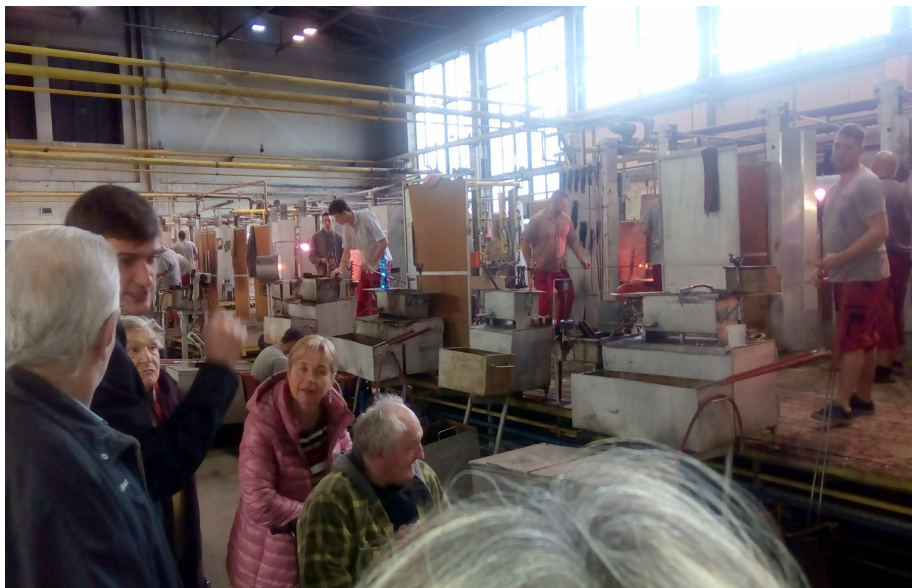
Prohlídka provozu u sklářských pecí.