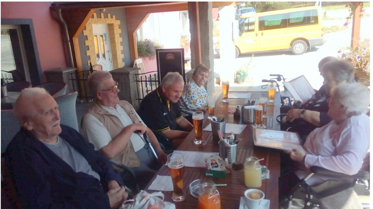
Ještě jedna fotka z posezení v restauraci Na truhlárně koncem léta...