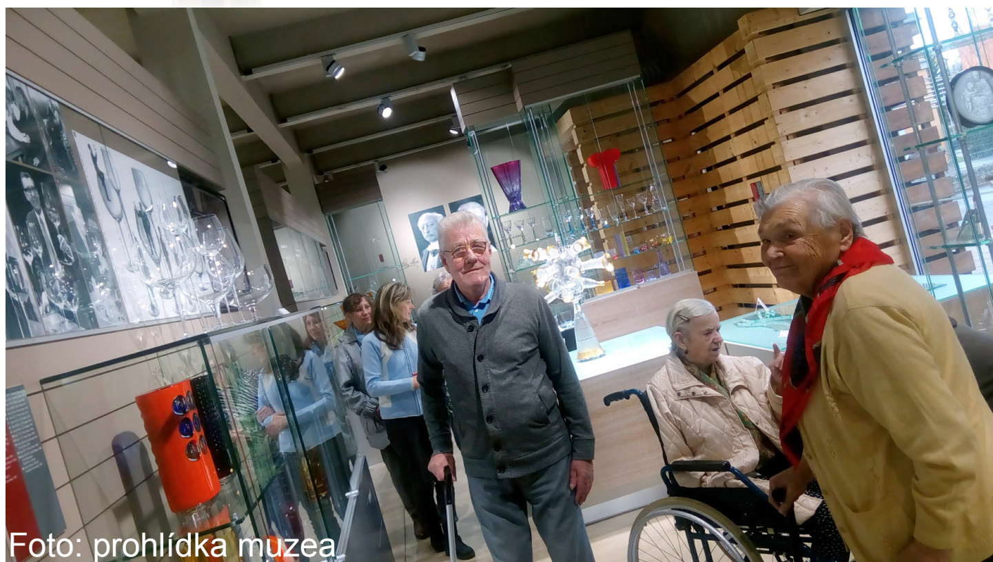
Foto: prohlídka muzea