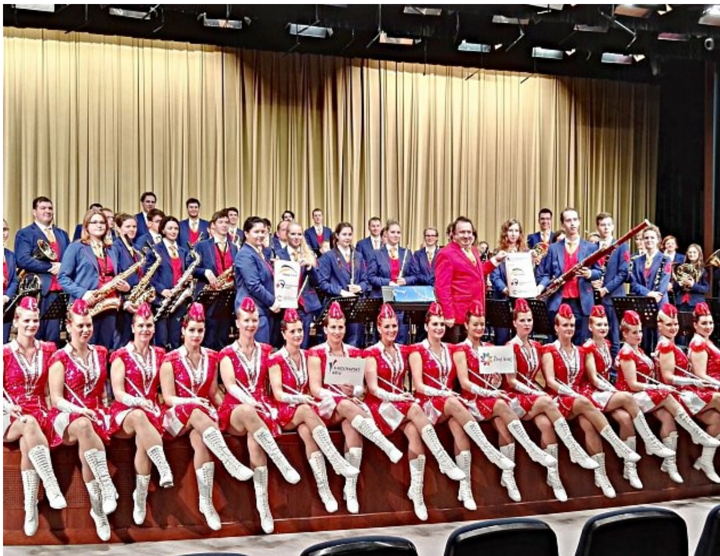
Foto: Kynšperské Majorettes v čínském Peking. Publikum svým vystoupením strhly k bouřlivým ovacím.