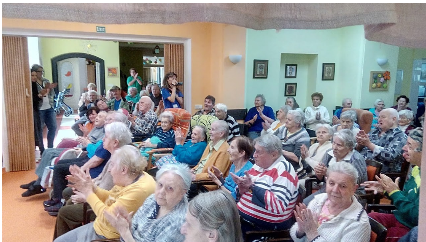
Foto: potlesk našich klientů patřící Yvettě Simonové (jídelna Zámeček)

roku 1958 spolupracuje s Orchestrem Karla Vlacha coby jeho hlavní pěvecká hvězda. Za svůj život nazpívala přes 500 písní, celou řadu z nich pak se svým dlouholetým kolegou zpěvákem Milanem Chladilem. V 60. letech 20. století zaznamenala značnou popularitu, umísťovala se na předních příčkách čtenářské ankety Zlatý slavík, kde byla na druhém místě v žebříčku popularity v letech 1962, 1964 a 1965. V té době také natočila velké množství dodnes známých písní, vystupovala velmi často v rozhlase i televizi. Je stále umělecky aktivní a doposud veřejně vystupuje. Paní Simonová měla navštívit naše zařízení už na jaře, společně se svým